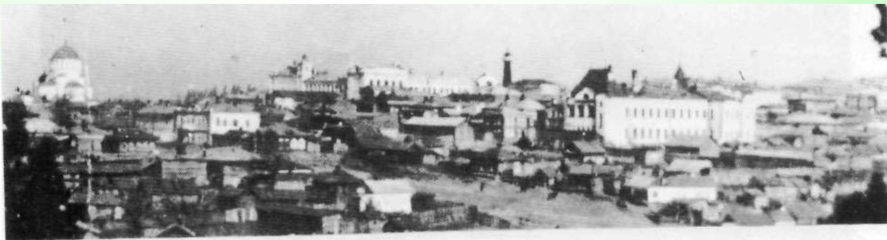
Новониколаевск, 1917 г.

Дружина Добровольного пожарного общества не смогла остановить огонь. Он вскоре перекинулся на депо и конюшни. вспыхнула тесовая каланча и рухнула, накрыв горящими обломками пожарный обоз с его бочками и лестницами. Прибывшие остальные пожарные обозы других команд оказались бессильными в борьбе с разбушевавшейся стихией огня. Общий убыток составил свыше 5-ти миллионов рублей золотом. В начале 19 века борцы с огненной стихией появились в Бердске и Ордынском. В начале 20 века ДПО появилось в Барабинске. За довольно короткое время добровольные пожарные общества стали серьезным подспорьем в борьбе с огненной стихией. Общественные помощники вели активную работу по тушению и предупреждению пожаров. Ново-Николаевск стал играть заметную роль во всех сферах социально - экономической жизни Западной Сибири. Благодаря удачному географическому расположению город превращался в торгово-транспортный центр края. Грузооборот станции Обь к 1913 году вырос до 30 млн. пудов, что составляло 11,3% грузооборота всей Сибирской железной дороги.