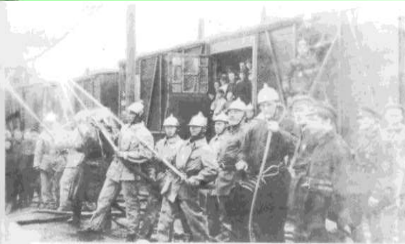
Пожарный поезд. 1930 г.

В начале 19 века борцы с огненной стихией появились в Бердске и Ордынском. В начале 20 века ДПО появилось в Барабинске.