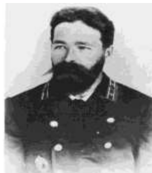
Николай Михайлович Тихомиров © 2000 - официальная фотография Николая Михайловича Тихомирова, сделанная в 1897 году в Санкт-Петербурге.

В помощь пожарным создано ДПО с числом 150 чел., существовало на помощь губстраха, получая отчисления 1% от страховых сумм.